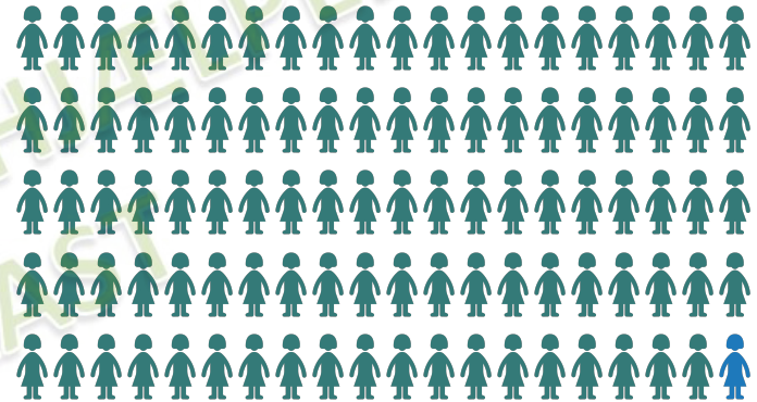
Risiko for infektion ved medicinsk abort

1 ud af 100 vil opleve infektion efter medicinsk abort