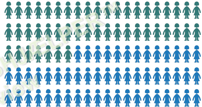
Træningens effekt på smerterne