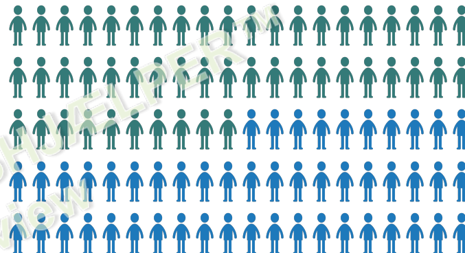
Blokade injektionens effekt på smerter